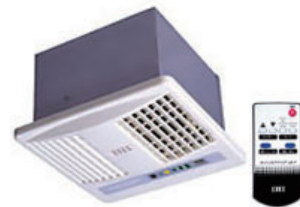
天井取付脱臭除菌機 eZ-7