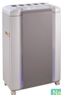
オゾンエアクリア eZ-3000