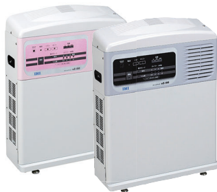
オゾンエアクリア eZ-100